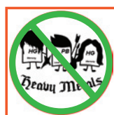
Free of Heavy Metals