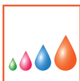
Piezo Variable Drop